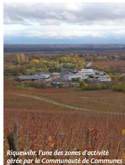
Riquewihr, l'une des zones d'activité gérée par la Communauté de Communes